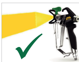
Идеальный факел распыления без полос