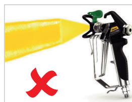
При появлении полос, плавно увеличивайте давление